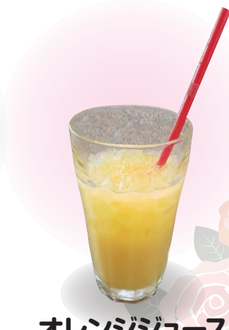
オレンジジュース 오렌지 주스 orange juice