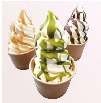
トッピング ソフト (チョコ)(キャラメル)(抹茶)