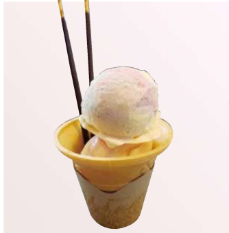
パステル マーブル アイス