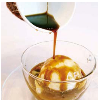
カフェ アフォガード