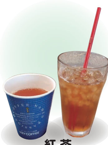
紅茶 홍차 black tea