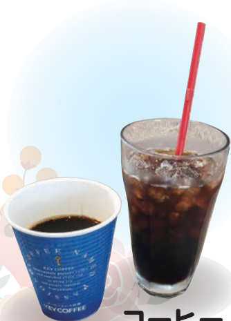
コーヒー 커피 coffee