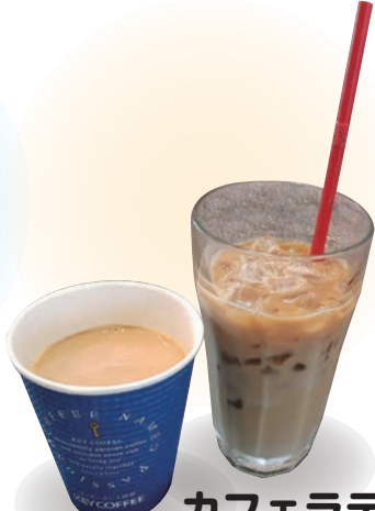
カフェラテ 카페라테 cafe latte