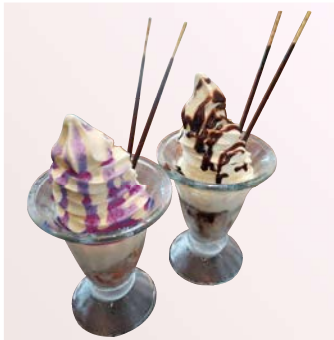
サンデー ソフト (チョコ)(ブルーベリー)